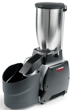
Sirman Измельчители льда , model Nordkapp :

Sirman Spa Viale dell'Industria 9/11 35010 PIEVE DI CURTAROLO (PD), Italy Tel./Fax. +39 049 9698666 / +39 049 9698688 email: info@sirman.com