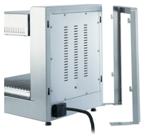
Wall mounted support optional