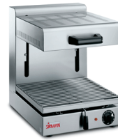
PRO 1/2 G