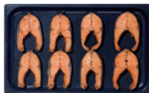
GN 1/1 поперечная загрузка

Ваше преимущество: большой плюс по загрузке - высокая производительность. Ускоряются все производственные процессы. Вы экономите не только рабочее время, но и ценную энергию.*